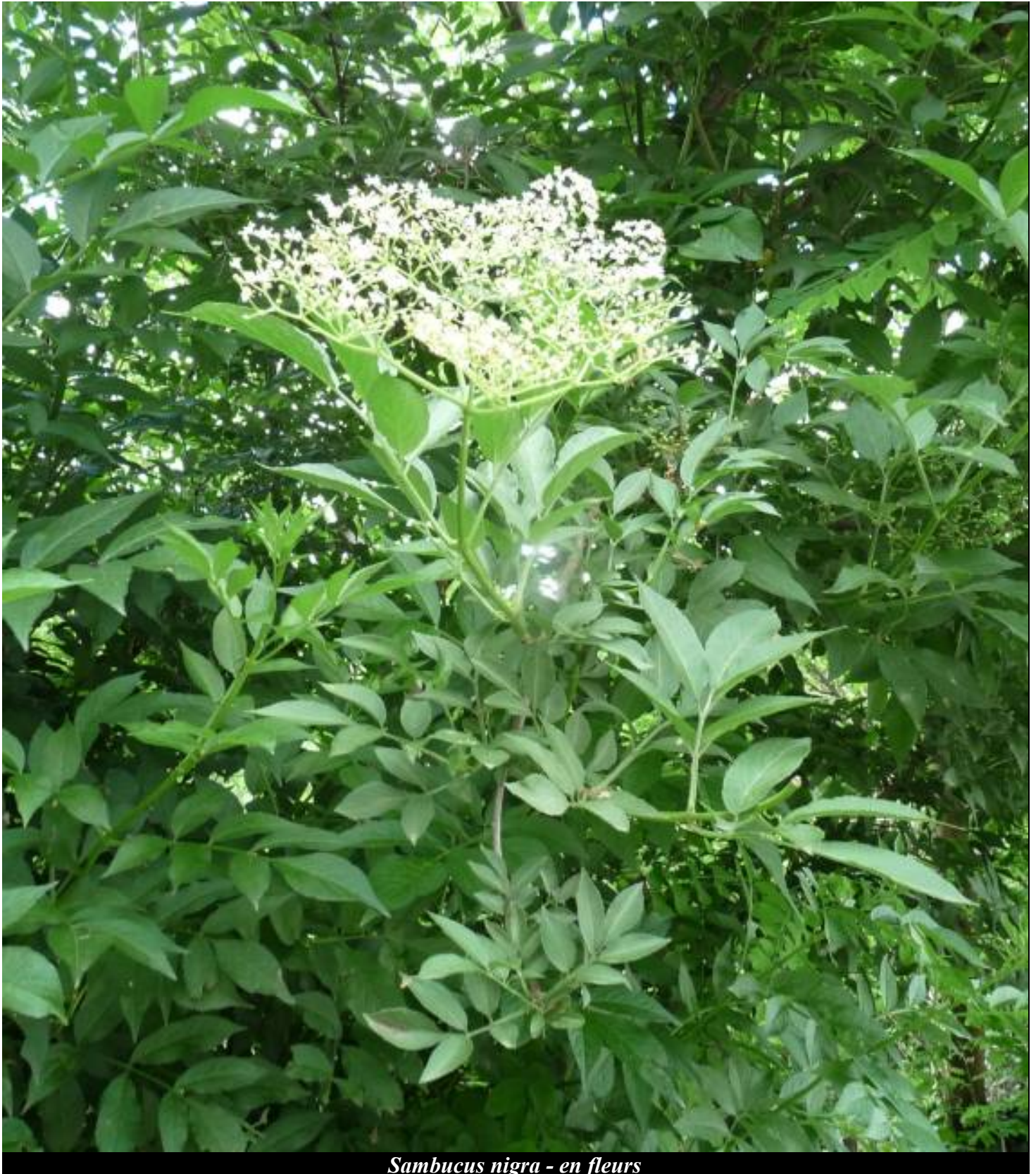
Sambucus nigra - en fleurs