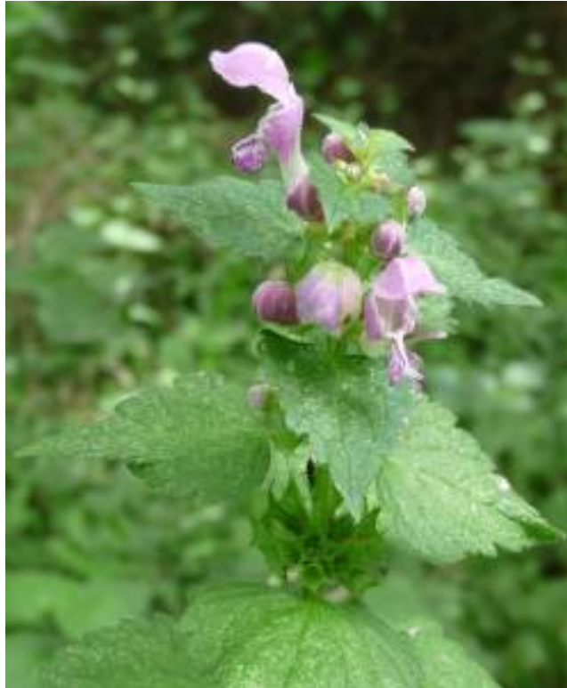
Lamium maculatum - Fleurs

FLEURS. Groupées à l'aisselle des feuilles. Elles peuvent être pourpre chez Lamium purpureum , jaunes chez Lamium galeobdolon , ou encore pourpres tachées de blanc chez Lamium maculatum .