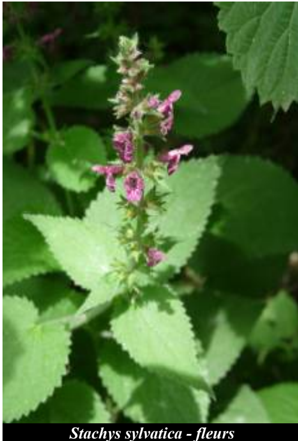
Stachys sylvatica - fleurs

FLEURS. Regroupées au sommet de la tige, pourpres, parfois tachées de blanc.