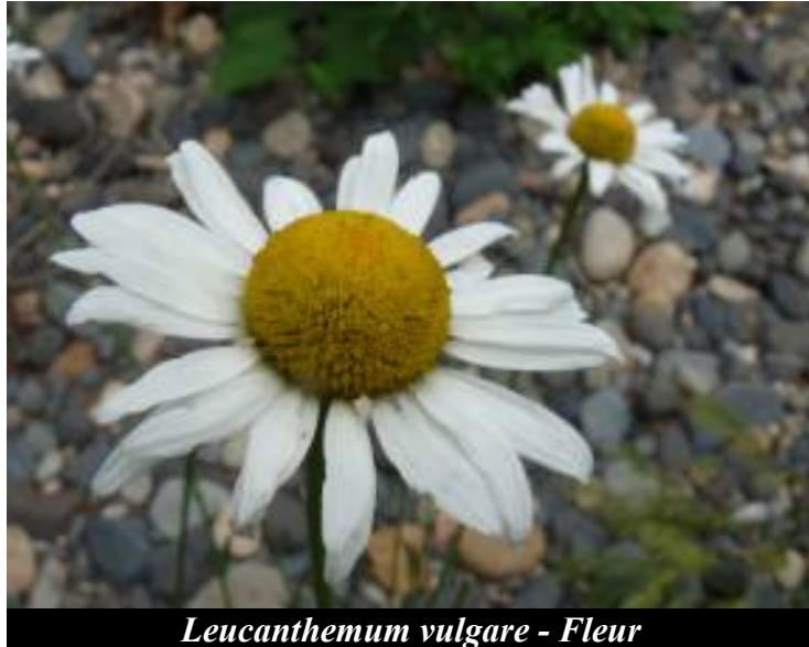
Leucanthemum vulgare - Fleur

FLEURS. Inflorescence composées de fleurs ligulées blanches et de fleurs tubulaires jaunes.