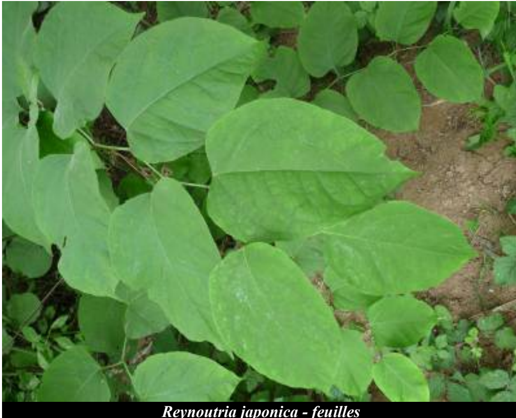
Reynoutria japonica - feuilles