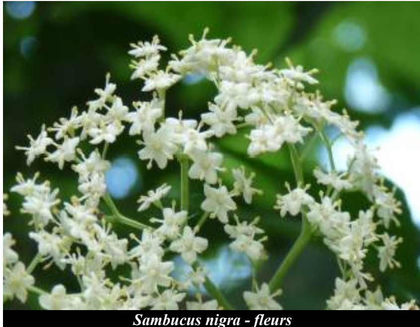
Sambucus nigra - fleurs

FRUITS. Baies noires portées par une tige devenue rougeâtre. A maturité ces fruits sont toujours tournés vers le bas.