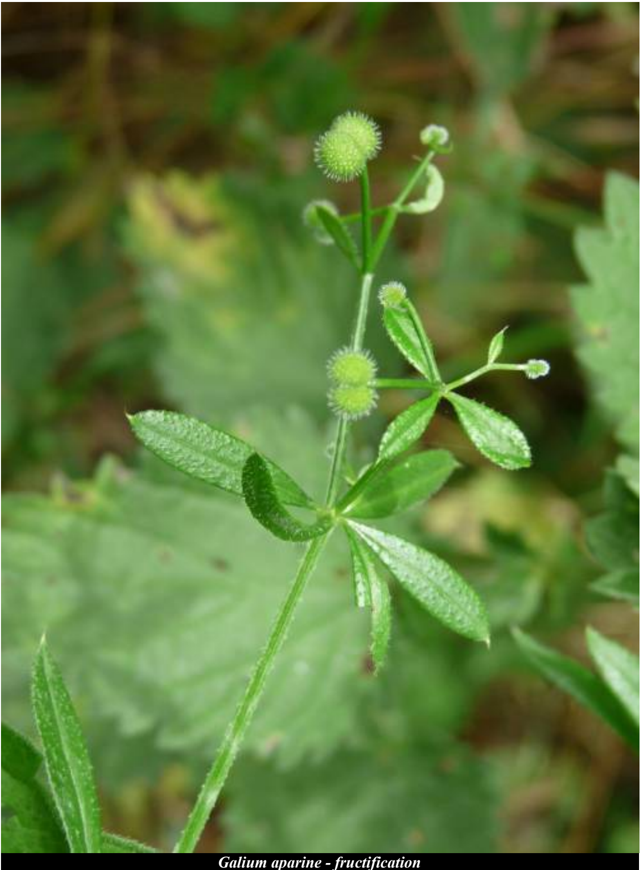
Galium aparine - fructification