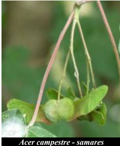
Acer campestre - samares

FRUITS. Regroupés par paire, ils sont constitués d'une graine et d'une grande aile, comme chez l'érable champêtre ( Acer campestre ) ci dessous. Ils sont appelés samares.